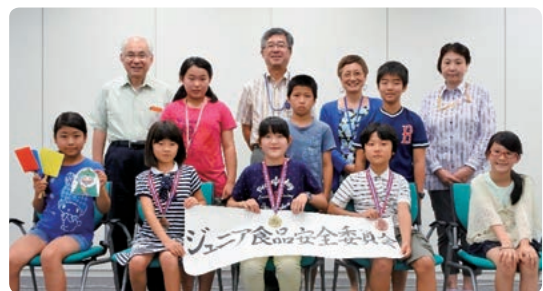
参加者全員と委員との記念撮影

参加してくださったみなさんが未来の科学者、科学の目で食の安全を守る大人になられることを期待しています。ありがとうございました。